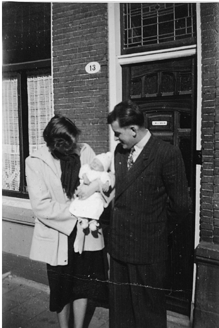
Mijn ouders in Schiedam met hun pasgeboren baby