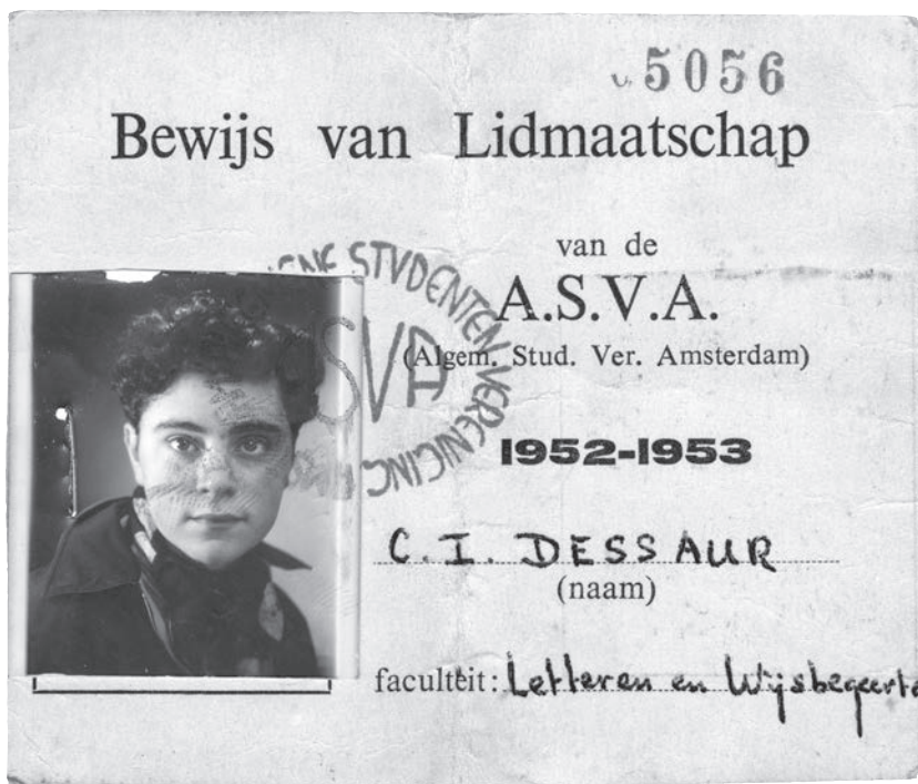
Ronnies lidmaatschapsbewijs van de ASVA.