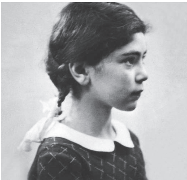
Schoolfoto van de Eerste Nederlandse Montessori School, 1938-1939.